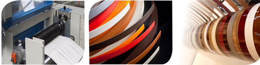
İşlem Sonucu Dilimlenmiş Folyolar Feeding Foils - Finish of Working